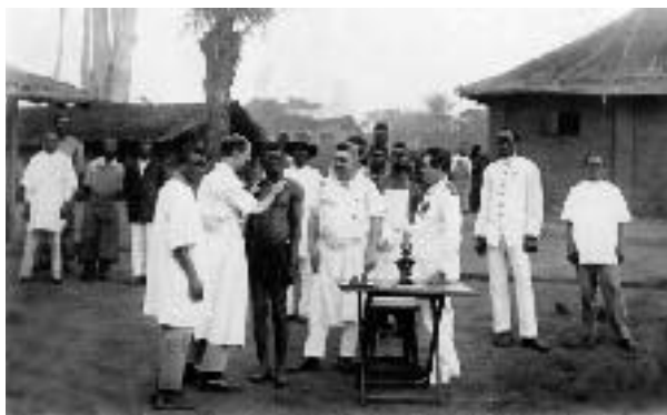
Cameroun, 1927 : la palpation ganglionnaire. Cameroon, 1927: the ganglionic palpation